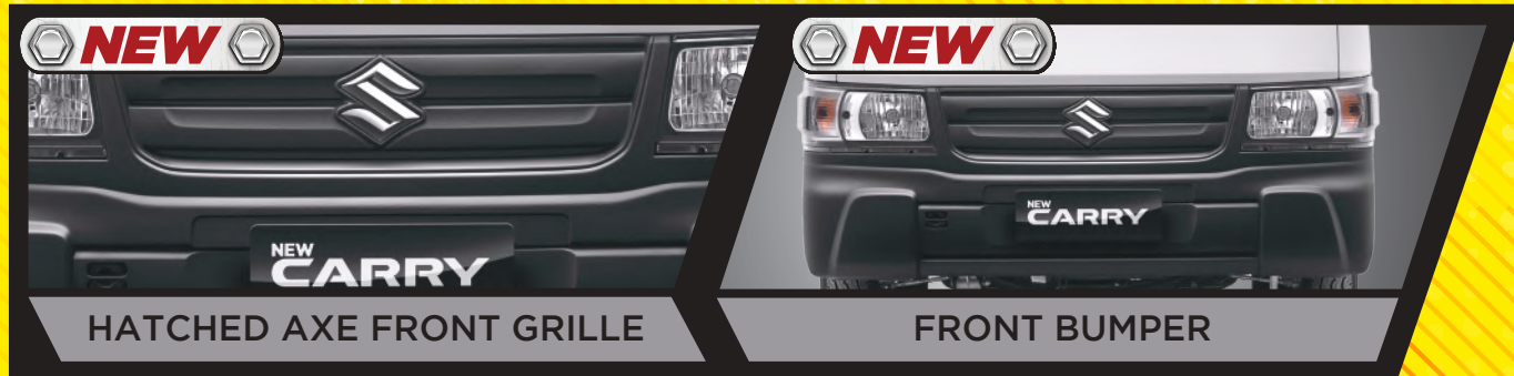
HATCHED AXE FRONT GRILLE

Tangguh dan kuat untuk bawa untung bisnis Anda.