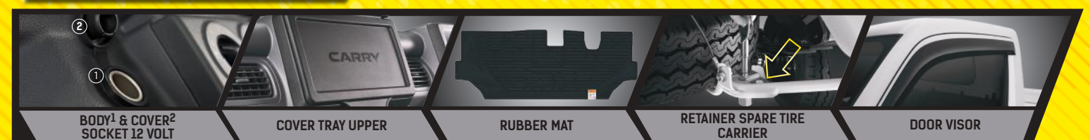
BODY 1 & COVER 2 SOCKET 12 VOLT COVER TRAY UPPER RUBBER MAT RETAINER SPARE TIRE CARRIER DOOR VISOR