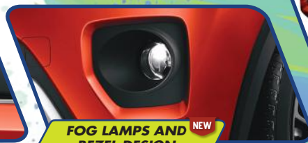
FOG LAMPS AND BEZEL DESIGN NEW

Headlamps yang tegas dengan cahaya yang terang, aman untuk berkendara