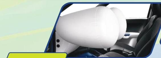
DUAL SRS AIRBAG

Melalui berbagai teknologi kaman terkini, NEW IGNIS berikan ketenangan serta kenyamanan saat berkendara.