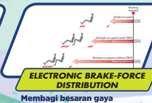
ELECTRONIC BRAKE-FORCE DISTRIBUTION

Fitur keselamatan semakin lengkap dengan tersedianya alat pemadam api ringan