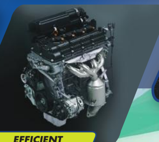
EFFICIENT K12M ENGINE

Mesin yang efisien dapat diandalkan untuk setiap perjalanan