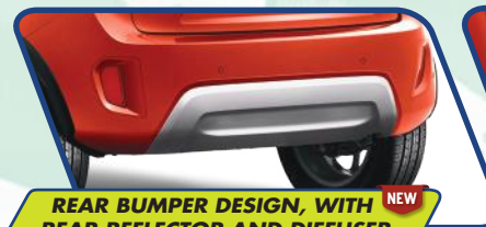
REAR BUMPER DESIGN, WITH REAR REFLECTOR AND DIFFUSER NEW

Desain baru untuk tampilan semakin elegan