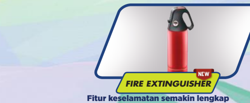
FIRE EXTINGUISHER NEW

Fitur keselamatan semakin lengkap dengan tersedianya alat pemadam api ringan