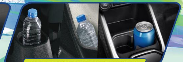
REAR & FRONT CONSOLE CUP HOLDER