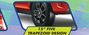
15" FIVE TRAPEZOID DESIGN