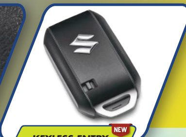
KEYLESS ENTRY NEW

Praktis dan dinamis dengan Push Start Stop Button