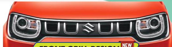
FRONT GRILL DESIGN WITH ACCENT CHROME NEW

Desain baru yang dinamis untuk tampilan makin stylish