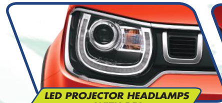
LED PROJECTOR HEADLAMPS WITH DRL

Desain baru yang dinamis untuk tampilan makin stylish