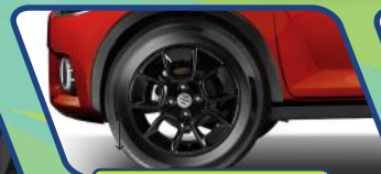
HIGH GROUND CLEARANCE (180mm)

Desain baru dengan tampilan semakin stylish