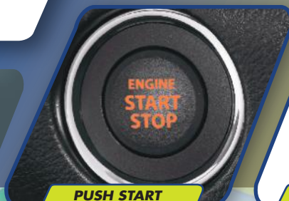
PUSH START STOP BUTTON

Mesin yang efisien dapat diandalkan untuk setiap perjalanan