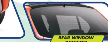
REAR WINDOW DEMISTER

Aman berkendara dengan desain jendela yang eksklusif