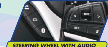
STEERING WHEEL WITH AUDIO SWITCH CONTROL & BLUETOOTH PHONE CONNECTION

Berkendara semakin nyaman dengan stir yang dapat disesuaikan