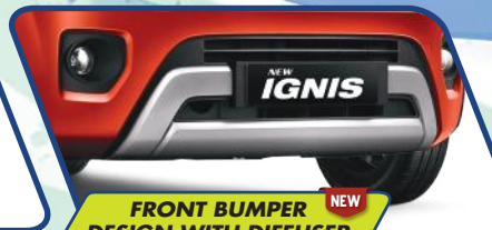
FRONT BUMPER DESIGN WITH DIFFUSER NEW

Tampilan baru bagian belakang kini semakin dinamis