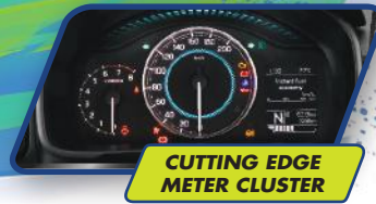
CUTTING EDGE METER CLUSTER

Serunya eksplorasi dengan mode touchscreen