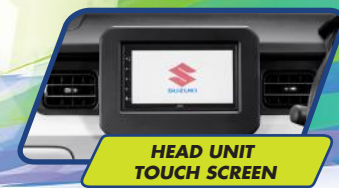
HEAD UNIT TOUCH SCREEN

Serunya eksplorasi dengan mode touchscreen