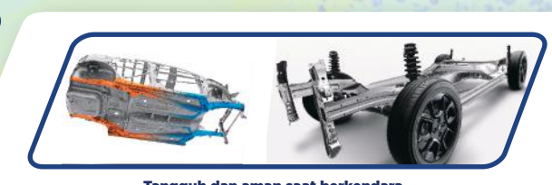
Tangguh dan aman saat berkendara

Mencegah roda mengunci saat pengereman mendadak