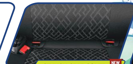
STYLISH SEAT COVER NEW

Lapang dan praktis untuk setiap eksplorasi