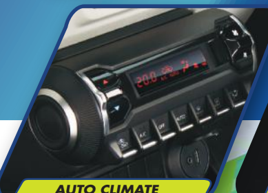
AUTO CLIMATE A/C WITH HEATER

NEW IGNIS sebagai generasi baru URBAN SUV, hadirkan fitur-fitur berkelas. Mendukung mobilitas perkotaan yang dinamis baik dari sisi kenyamanan, keamanan, dan juga power.