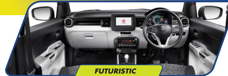
FUTURISTIC INSTRUMENT PANEL