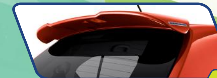
REAR UPPER SPOILER