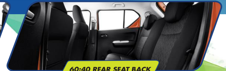
60:40 REAR SEAT BACK