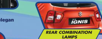
REAR COMBINATION LAMPS

Hadirkan tampilan yang dinamis dan sporty